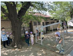
『かくれんぼ』 みつけた！