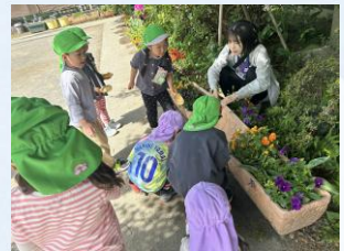
プランターの下には 何がいるかな？