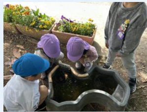
「オタマジャクシさん元気かな～」 みんなで見守っています