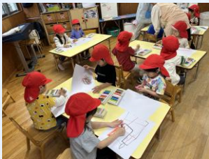
『年少組 初めての絵』大きな紙に自由に絵を描きました。 一人ずつ何を描いたのか先生に話しをしてくれました