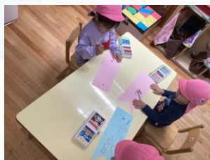
『年少組 こいのぼり制作』クレヨンやシールを使って飾りつけをしました ☀️ こいのぼりの表情がとても可愛らしいですね♪