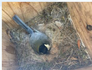
びわの木にある巣箱に今年もシジュウカラが卵を産みました！みんなで優しく見守っていきましょう