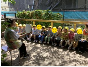
年少さんデッキに初めて出ました ☀️ ポカポカ陽気の中絵本や紙芝居を読みました