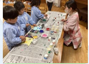
『年中組 こいのぼり制作』 スタンプで模様をつけました