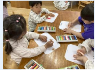
『年中組 当番カード』 自分の顔を描きました♪