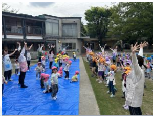
『年少組 体操見学』 少しずつ一緒に体操する子が増えてきました ✨