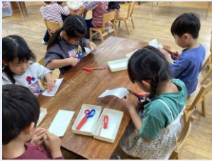
『年長組 こいのぼり制作』 障子紙にしっぽを書いて丁寧にハサミで切りました※素敵な模様も描きましたね