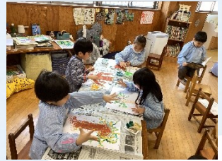
年長組『いのみの木の絵』みんなが大好きな『いのみの木』。描く前にクラスの友だちと一緒に見に行きました。いのみの葉は指絵具で…想いを込めて描いた絵はどれも素敵です。卒園まであと数日…大切に過ごしていきたいです。