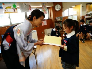
担任の先生から一人ずつ証書を手渡しされました