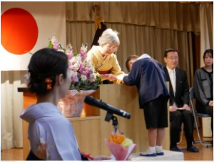
『卒園証書授与』 みんなに見守られながら1人ずつ園長先生から証書を授与されました