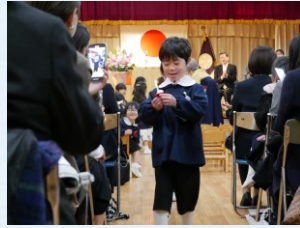
園燈の火が消えないように…沢山の方に見守られながら退場です