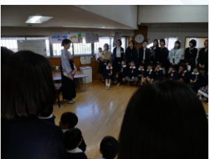
保護者の皆様、日々のご協力本当にありがとうございました。 また幼稚園に遊びに来てくださいね