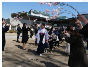
先生やご家族の方に見守られて最後の花道 ご卒園本当におめでとうございます