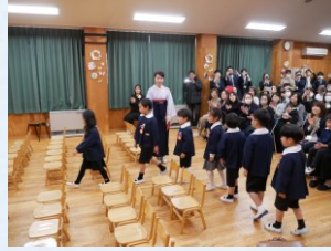
『卒園児 入場』 少し緊張した面持ちで入場です。お兄さん・お姉さんになりましたね