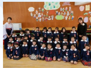
卒園式後にクラスみんなで最後の集合写真です☆