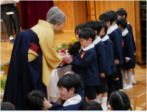
園長先生から1人ずつ園燈を受け取り退場しました