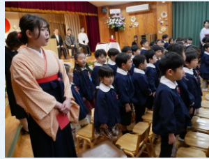
『いのみ・ドキドキドン！一年生』 心がこもった年長組さんの歌はとても素敵でした♪