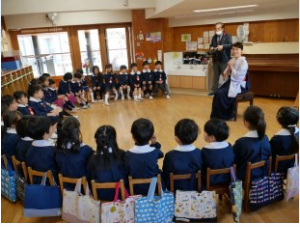
『最後の朝の会』 お休みの子が1人もいない全員揃った卒園式の朝を迎えられました☀